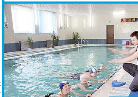
В бассейне проходит занятие по аквааэробике