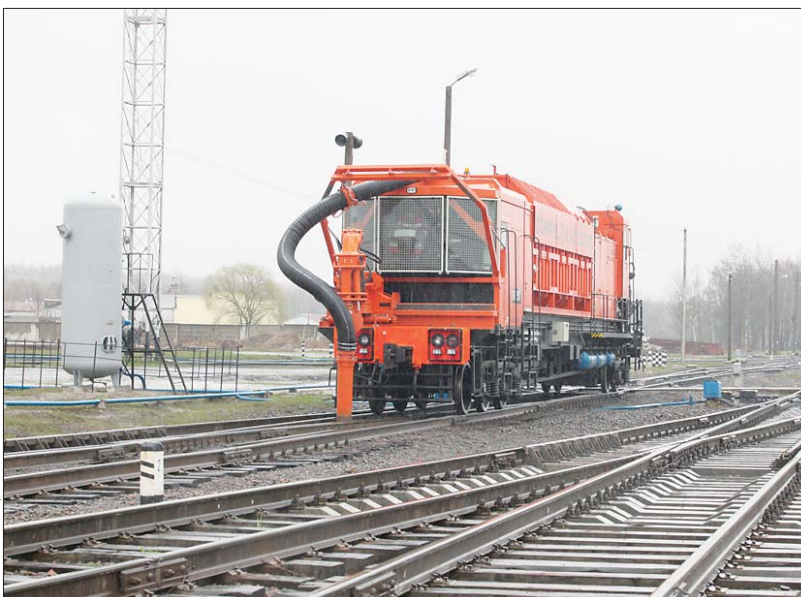
Обслуживание новых путей ведет современная техника

Кстати, максимальные размеры среднесуточного поездопотока, переработанного по станции Ситница, отмечены в прошлом году. Тогда ежесуточно в среднем расформировывалось 11 и формировалось 11 поездов в сутки, средняя погрузка со-