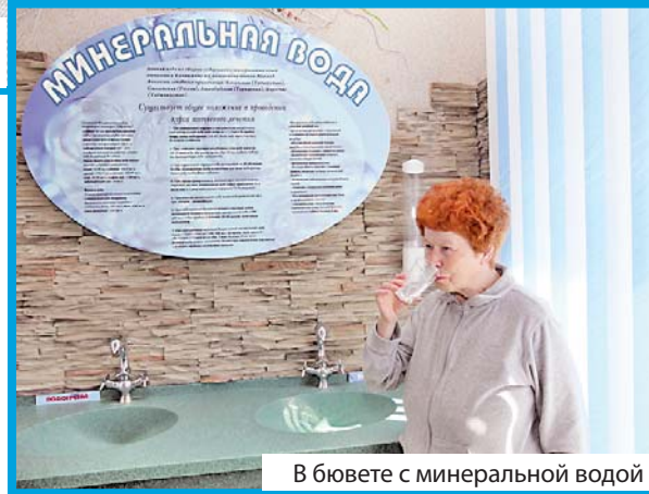
В бьюете с минеральной водой

лактики остеопороза и переломов). А вообще мы следим за всеми медицинскими новинками. Так, в 2011 году санаторий приобрел SPA-капсулу, современные массажные кресла и контрастные ванны.