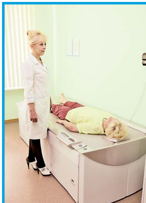
Процедура бесконтактного массажа