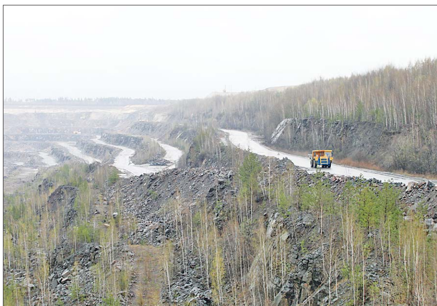
Карьер РУПП «Гранит» – сверху словно горный серпантин

ставляла 625 ваг./сутки. Для сравнения: в 2010-м – 607 ваг./сутки, в 2009 году – 583 ваг./сутки. При этом 30% вагонопотока включалось в поезд, формируемые в направлении Калинковичей, 70% – в направлении Лунинца. Одновременно с