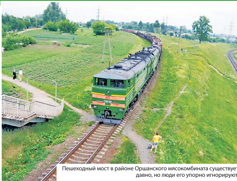
Пешеходный мост в районе Оршанского мясокомбината существует давно, но люди его упорно игнорируют.