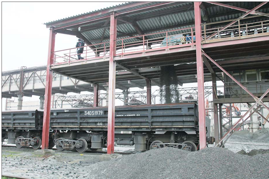
Идет погрузка щебня

– был приемосдатчиком, маневровым диспетчером. Затем несколько лет работал начальником станции Микашевичи, а в 1997 году вновь вернулся сюда. На его глазах, можно сказать, и шло современное становление станции. К примеру, еще десять лет назад здесь в сутки грузилось около 400 вагонов. Сейчас – почти вдвое больше.