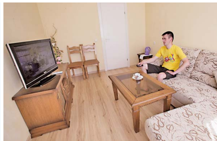
Уютно и красиво в каждой комнате

Маршрут проезда: дизелем Могилев — Орша, Могилев — Шклов до станции Польшковские Хутора, из Могилева доставка автобусом «Санаторий «Дубровенка» с привокзальной площади железнодорожного вокзала.