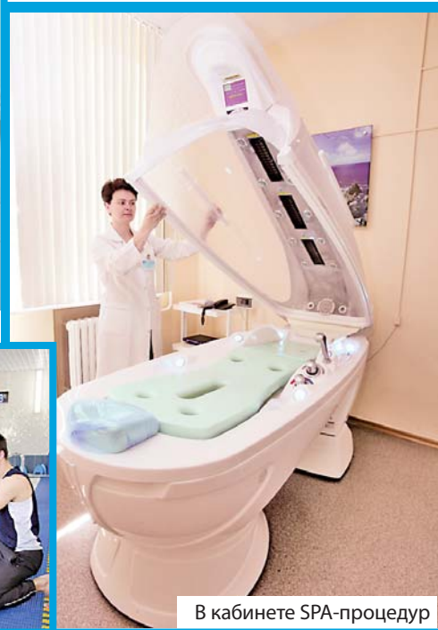
В кабинете SPA-процедур